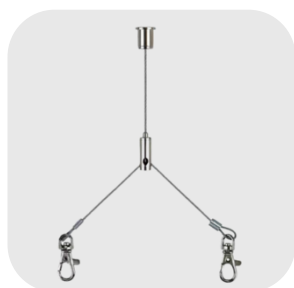
FILIN DE SUSPENSION EN Y : SUS600T