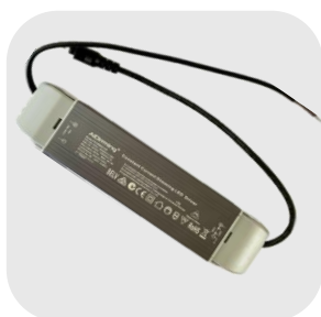
CONVERTISSEUR GRADUABLE : CD40DIM-C600T