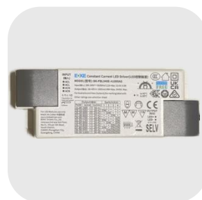
CONVERTISSEUR NON DIMMABLE POUR C600 11 REGLAGES DE PUISSANCE : CONV-C600REG