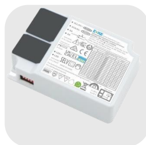
DRIVER DALI PUSH RÉGLABLE : CD40B-DALI/PUSH