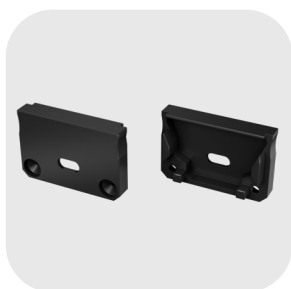
EMBOUT DE FINITION PERCÉ : DEC-1206-400