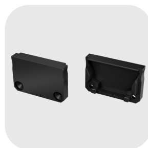
EMBOUT DE FINITION PLEIN : DEC-1206-401