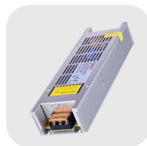
CONVERTISSEUR 24VDC <1500CM : LT24250