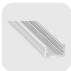
PROFILÉ ALU 200CM OPAQUE : DAL-10001