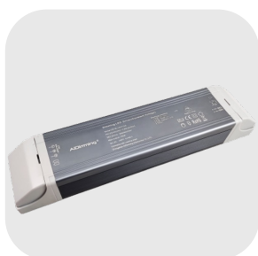
CONVERTISSEUR GRADABLE <800CM : LT24150(DIM)