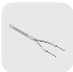
FILS DE LIAISON AU M: FIL2P