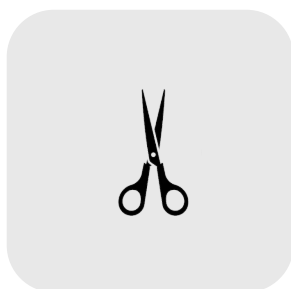
FRAIS DE FABRICATION UNITAIRE : FD