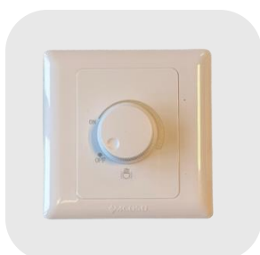
VARIATEUR 200W : VARI 200